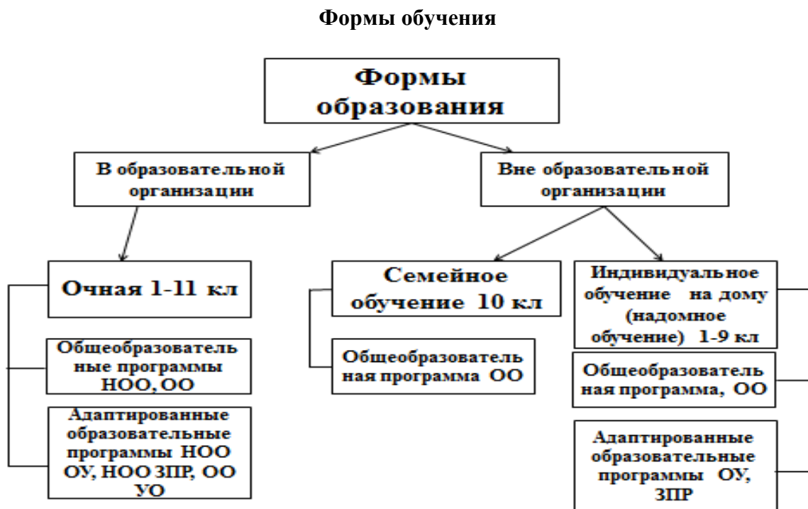
Рис. 2 Формы обучения

Основная общеобразовательная программа среднего общего образования.